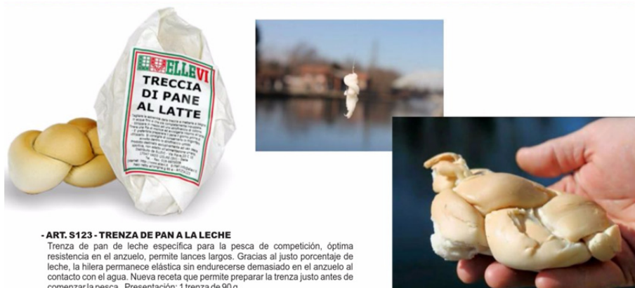
- ART. S123 - TRENZA DE PAN A LA LECHE Trenza de pan de leche específica para la pesca de competición, óptima resistencia en el anzuelo, permite lances largos. Gracias al justo porcentaje de leche, la hilera permanece elástica sin endurecerse demasiado en el anzuelo al contacto con el agua. Nueva receta que permite preparar la trenza justo antes de comenzar la pesca. Presentación: 1 trenza de 90 g.

En días de picadas delicadas es recomendable una vez hecho todo el procedimiento anterior coger un trozo de trenza ya seca y volverla a meter en agua para ir cogiendo trozos de la misma y con sumo cuidado enhebrarlos en el anzuelo de manera muy delicada para darle aún más naturalidad a nuestra presentación.