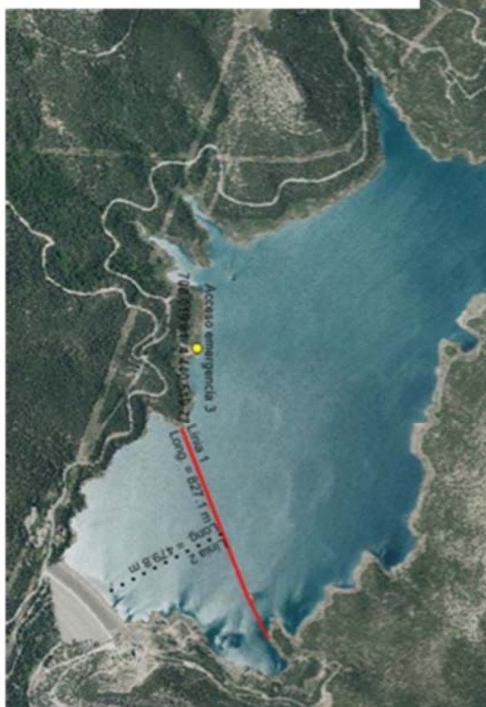
EMBALSE DE ARENOSO